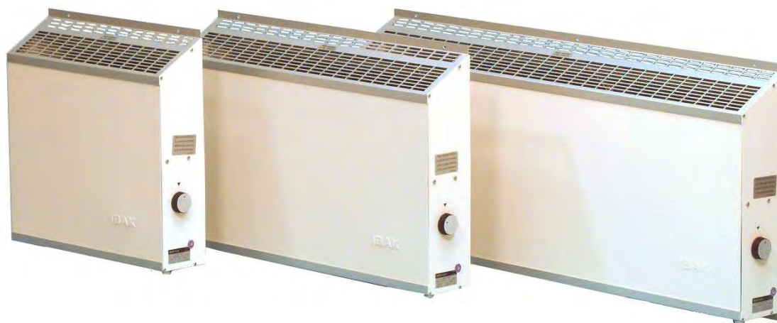
Abb./ photo: HACO400